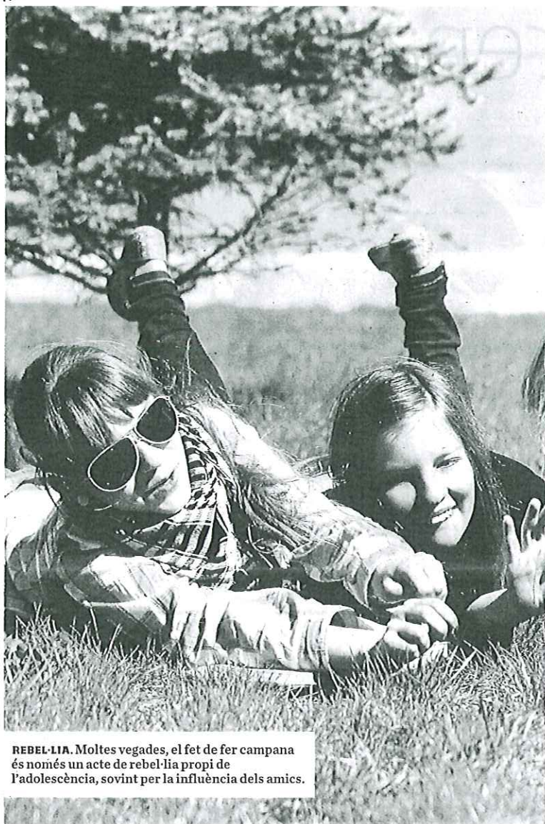
REBEL·LIA. Moltes vegades, el fet de fer campana és només un acte de rebel·lia propi de l'adolescència, sovint per la influència dels amics.

Però, encara que molts dels adolescents que falten a classe ho fan de manera esporàdica i sense conseqüències greus per al seu futur acadèmic, no podem caure en el mateix error que els guionistes de cinema nord-americans i donar l'esquena a una realitat que preocupa cada vegada més a polítics i educadors: l'alt percentatge d'abandonament escolar que registren Catalunya i l'Estat i l'absentisme que hi ha abans que s'arribi a aquest punt. Segons l'informe PISA de l'any 2012, el 26,5% dels joves d'entre 18 i 24 anys van abandonar els estudis a Espanya i, segons el mateix document però de l'any 2009, un de cada tres alumnes