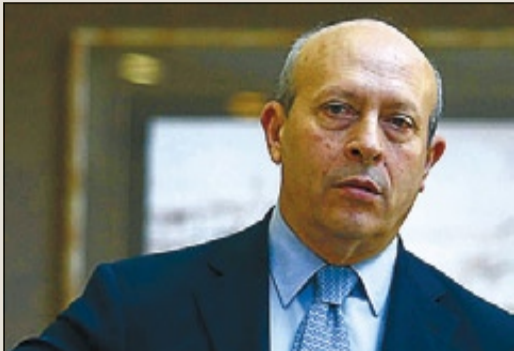
JOSÉ IGNACIO WERT MINISTRE D'EDUCACIÓ