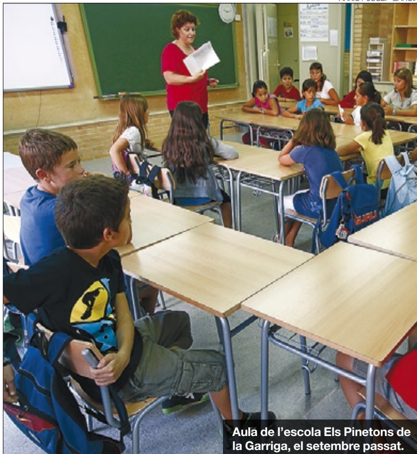
Aula de l'escola Els Pinetons de la Garriga, el setembre passat.

l'ESO per obtenir el títol obligatori. Els pedagogs veuen aquesta possibilitat poc realista.