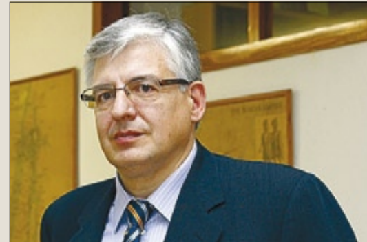
CARLES ARMENGOL FUND. ESCOLA CRISTIANA

«És la primera llei que gasta més de la meitat a segregar l'alumnat. Instaura un sistema elitista. La FP bàsica i devaluada serà l'alfombra per amagar-hi a sota l'abandonament educatiu»